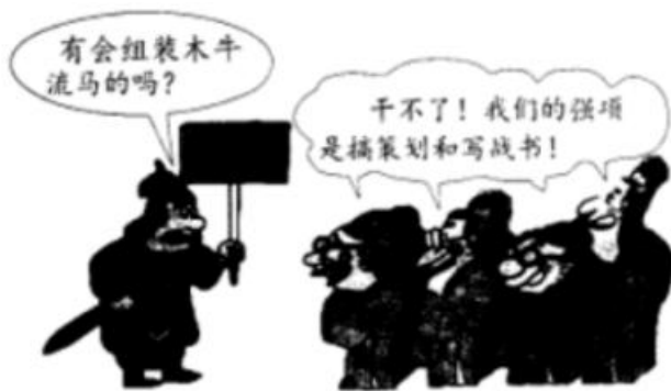
改编自周喜悦漫画《怀才不遇》