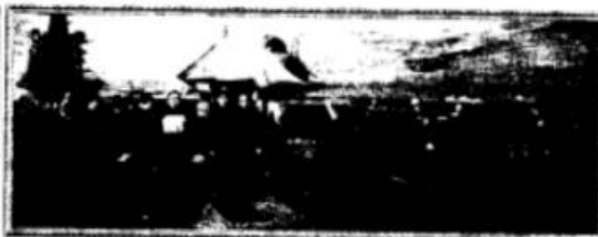
油画《航空报国的楷模——罗阳》（作者：张峻明）