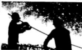
“一代人、一口气、一炉钢”！钢铁工人夜以继日地奋战在炼钢一线。