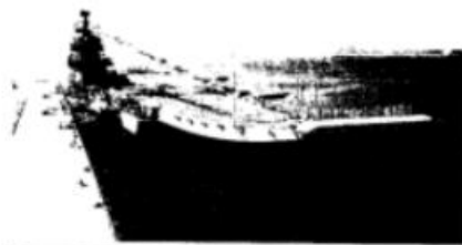
由大连船舶重工集团有限公司建造的中国第一艘国产航母——山东舰。