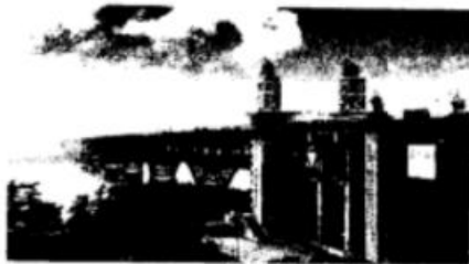
被誉为“争气钢”的鞍钢桥梁钢撑起了南京长江大桥。