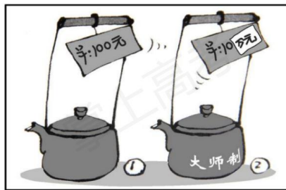
《摇身一变》 作者：王铎