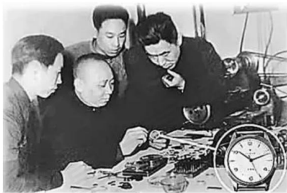
四名工人在简陋的条件下研制手表

奋战数月，研制出第一块国产手表，用智慧的双手结束了“中国只能修表，不能造表”的历史。由此可以看到当时