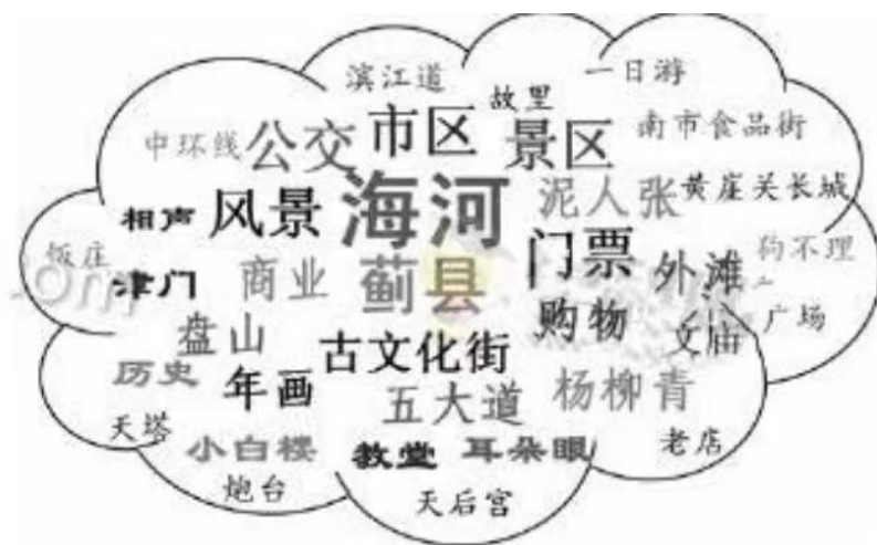
2006年度“天津旅游”词云图