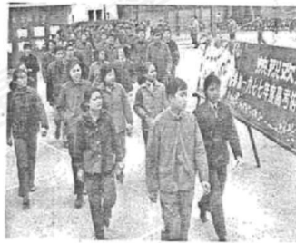
图4 1977年参加高考的考生

照片是触摸历史脉搏、感受生命温度的媒介。围绕“历史中的人”，提取以下一幅或多幅照片信息，自拟论题，展开论述。（要求：主题明确，史论结合，表述清晰）