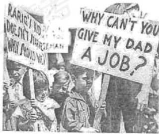
图3 1929年经济大危机中的孩子