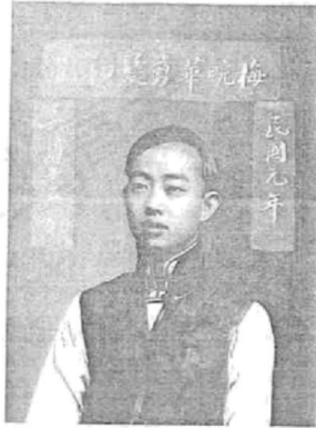
图2 1912年剪发后的梅兰芳