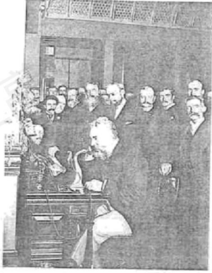
图1 1892年在纽约展示电话机的贝尔