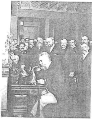
图1 1892年在纽约展示电话机的贝尔