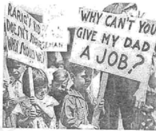
图3 1929年经济大危机中的孩子