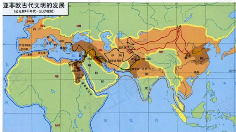
——张芝联等《世界历史地图集》